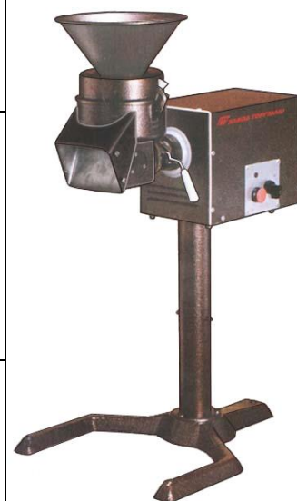
Приводной механизм на подставке; укомплектован протирочным механизмом МО-2.

В зависимости от набора сменных насадок УКМ предлагается в нескольких исполнениях: