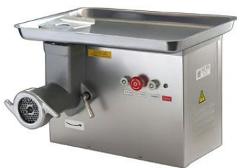
МИМ 300 М